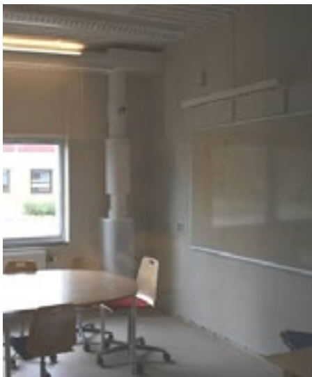
Den gamle installasjonen på grupperommet.