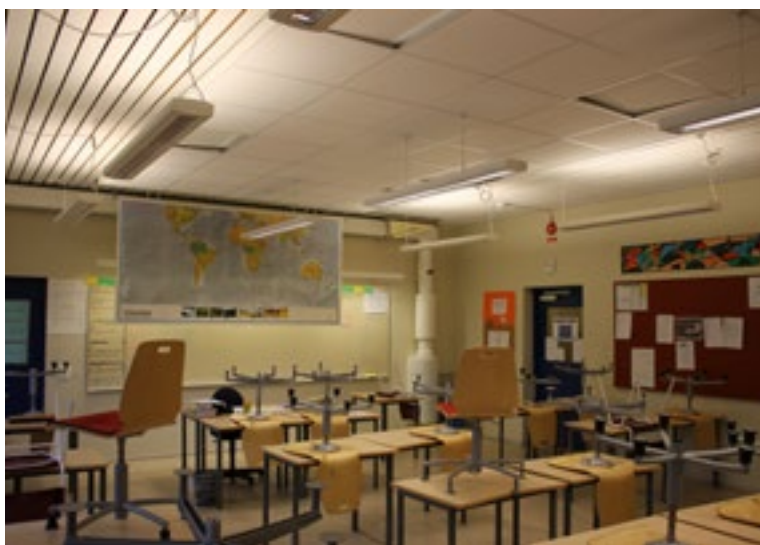
Den gamle installasjonen med eldre T5-armaturer.

eControl fra Thorns 15 måter å oppnå enkel og energieffektiv belysning - Følgende var avgjørende for å redusere energiforbruket på Västervångskolan: